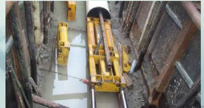
AUGER BORING PIPE