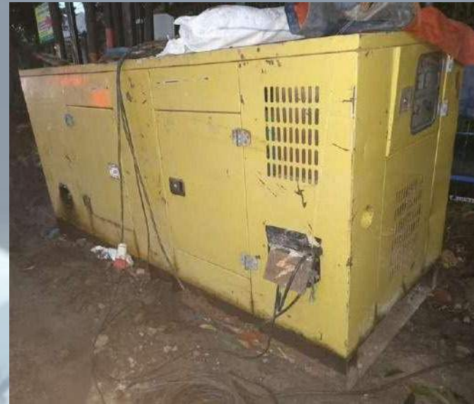
GENSET 72 Kva